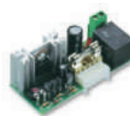
CARICA karta ładowania akumulatorów do siłownika RO1124