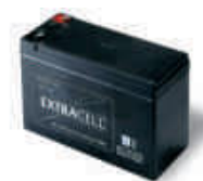
B12-B akumulator 12 V 6.0 Ah do siłowników 24V