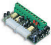
PIU karta rozszerzająca funkcje central (funkcje strona 48/49)

inne dodatkowe akcesoria - patrz strony 80 - 87