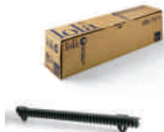
LOLA listwa zębata nylonowa M4, w odcinkach po 0,5 metra, pakowana po 10 sztuk, cena za 5 mb