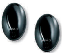
BF fotokomórki (para), zasięg 15 - 30 m