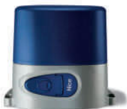
ROKIT siłownik 230V z wbudowaną centralą sterującą